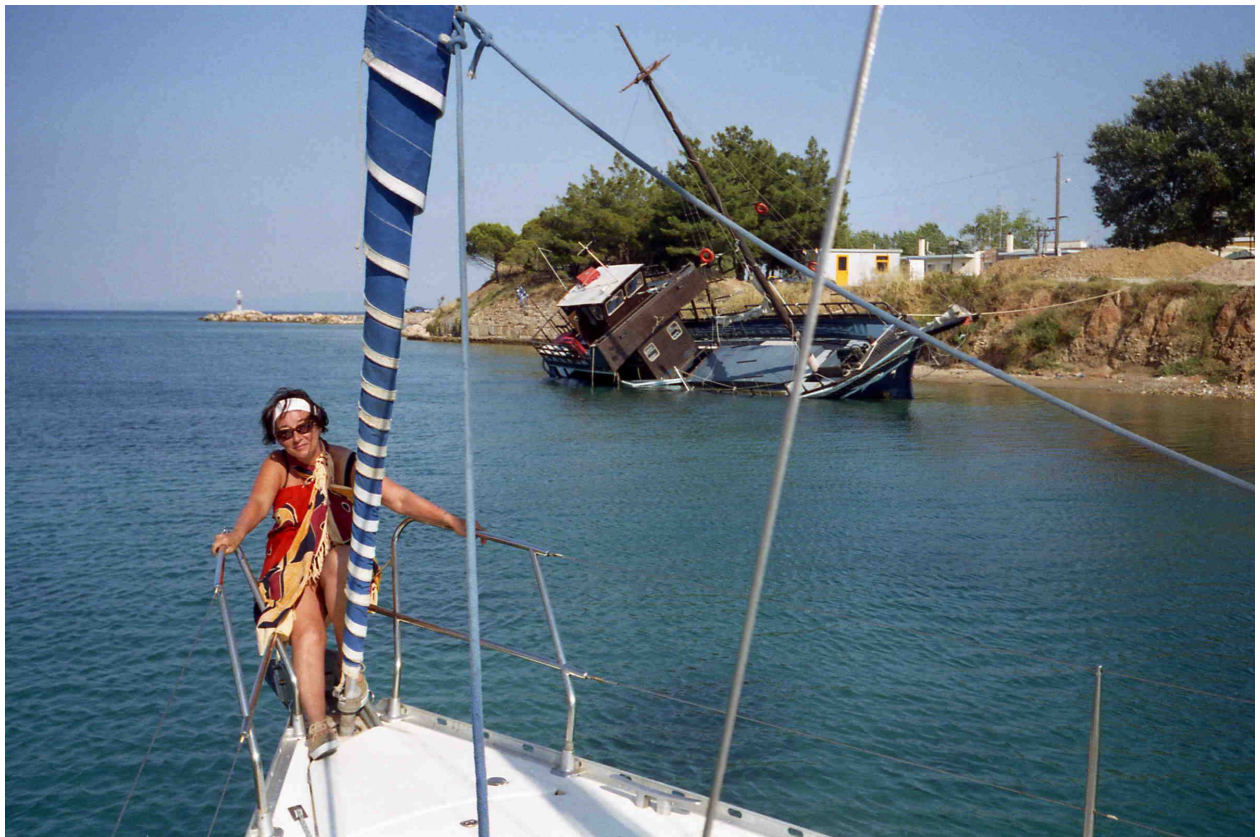
Oben: Im Kanal der Halbinsel Kassandra

Relativ spät laufen wir aus und haben keine Probleme, die fremde Kette über unserem Anker zu beseitigen. Der Versuch, zwei Fischern zu helfen einen schweren Anker vom Meeresgrund mit Hilfe unserer Ankerwinde zu bergen, müssen wir nach einiger Zeit aufgeben. Um 17:30 fahren wir durch den Kanal im Norden von Kassandra. Die ursprüngliche Absicht, mit vollen Segeln durch den Kanal und die Brücke zu segeln, geben wir auf. Reicht die Brückenhöhe von 18m wirklich für unseren Mast? Sie reicht! Aber die Perspektive bei der Ansteuerung ließ doch Zweifel aufkommen. Ohne Wind geht's dann die Ostküste von Kassandra entlang, bis wir vor der Stadt Afilos Anker werfen. Zum Abendessen gibt ein „Highlight“: Gefüllte Paprika und griechischen Salat. Nachts gibt es ausnahmsweise Wind und Regen.