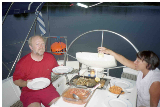
Oben: Fischplatte an Bord