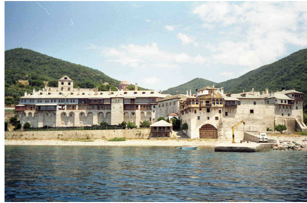
Oben: Die Klöster der Mönchsrepublik beherbergten früher tausende von Mönchen