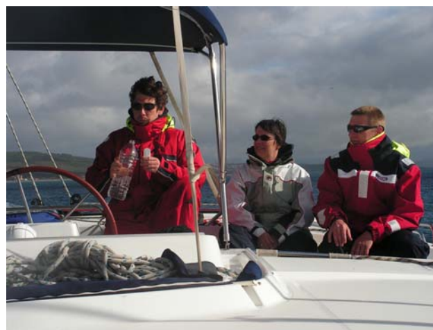
Oben: Auf der Brücke