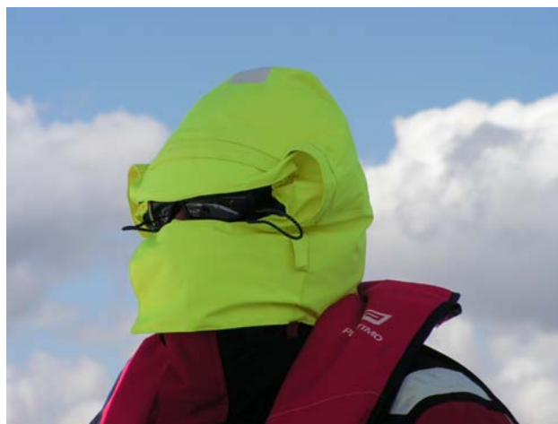
Karlheinz und Dirk bei Temperaturen um 8° C und Wind bis 8 Bft