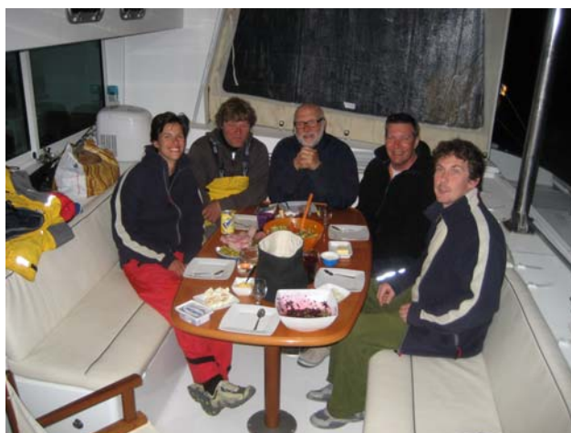
Oben: Im Außensalon beim Abendessen