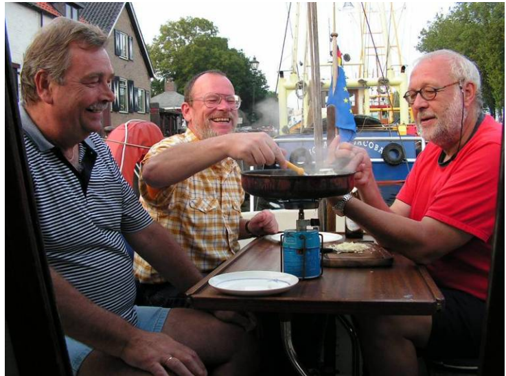
Rechts: Käsespätzle aus der Pfanne

Käse-Zwiebel-Spätzle sind als Abendessen angesagt. Ein „Alle-Mann-Manöver“, auch wenn es nur darum geht, den Topf auf dem einflammigen Kocher festzuhalten. Danach machen wir einen ausgiebigen Stadtrundgang und sitzen abends noch lange an Bord zusammen. Um 4 Uhr morgens sind auf einmal alle wach – warum?