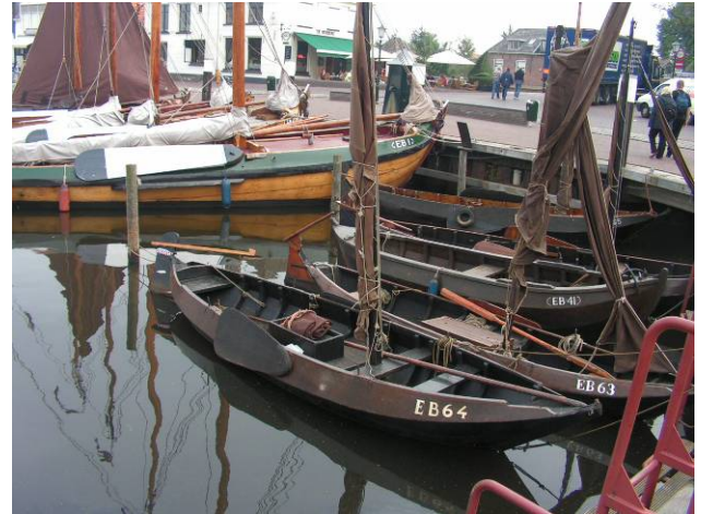
Oben: Elburg, die alte Hafenstadt an der früheren Zuidersee

Erst kurz vor unserem Ziel, im Veluwemeer gibt es wieder Wind (W 2-3 Bft); der wird genutzt abwechselnd noch ein paar Wenden zu fahren. Die letzten 1,5 sm laufen wir unter Motor. Weil die Lichtmaschine noch immer kaputt und die Batterie leer ist, muss Eberhart wieder kräftig den Motor ankurbeln.