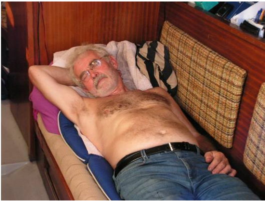
Oben: Skippers Mittagsschläfchen