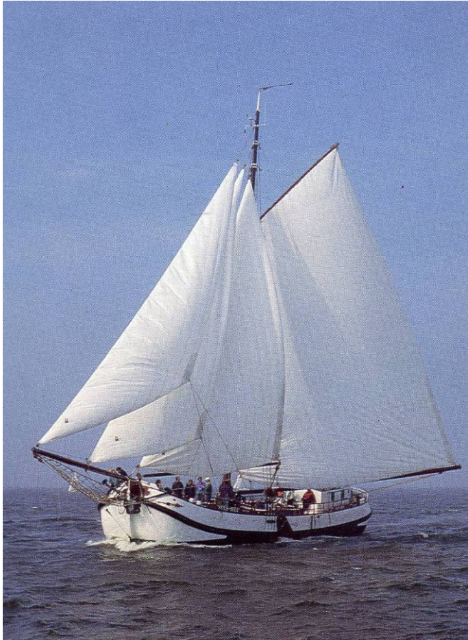
Bilder oben: Die „Spes Mea“ mit vollem Tuch