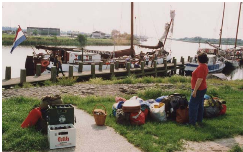
Bild rechts: Zurück im Makkum – die „Spes Mea“ wird geräumt. Das war sicher nicht unser letzter Törn!