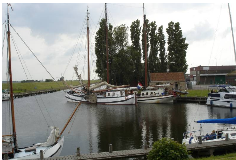
Die Witte Wiefke im Vorhafen von Workum