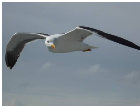
Die Möwe begleitet uns längere Zeit