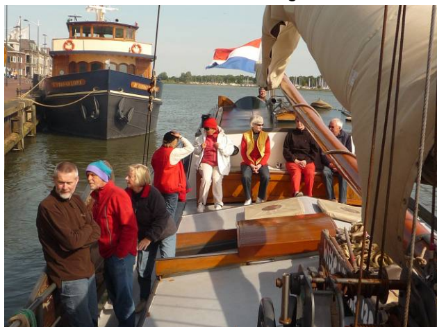
Auslaufen aus Kampen

Gegen 10 Uhr laufen wir aus; Wind Ost 4-5. Mit diesem guten Wind erreichen wir unser Ziel, Workum um 18 Uhr. Nach dem ersten Anlegeschluck auf dieser Reise machen wir einen Stadtspaziergang.