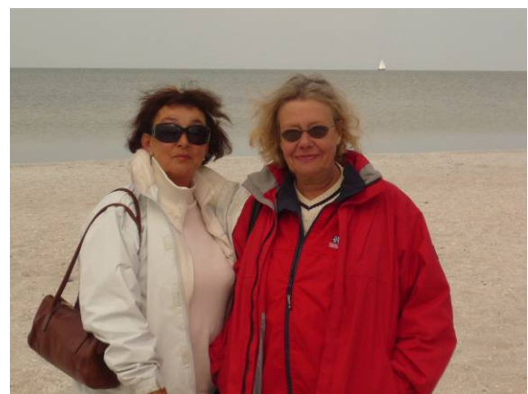
Unten: Spaziergang am Strand von Workum