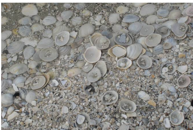
Oben: Roos wird 5 Jahre alt