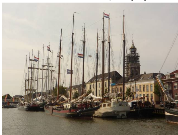
Kampen bleibt zurück